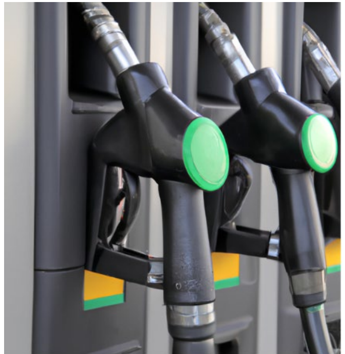
Figure 2 : Une pompe à essence qui distribue du biocarburant – généré à l'aide de l'I.A. DALL -

Fermentation de la levure, comment mesurer la fermentation de la levure, facteurs affectant la fermentation de la levure