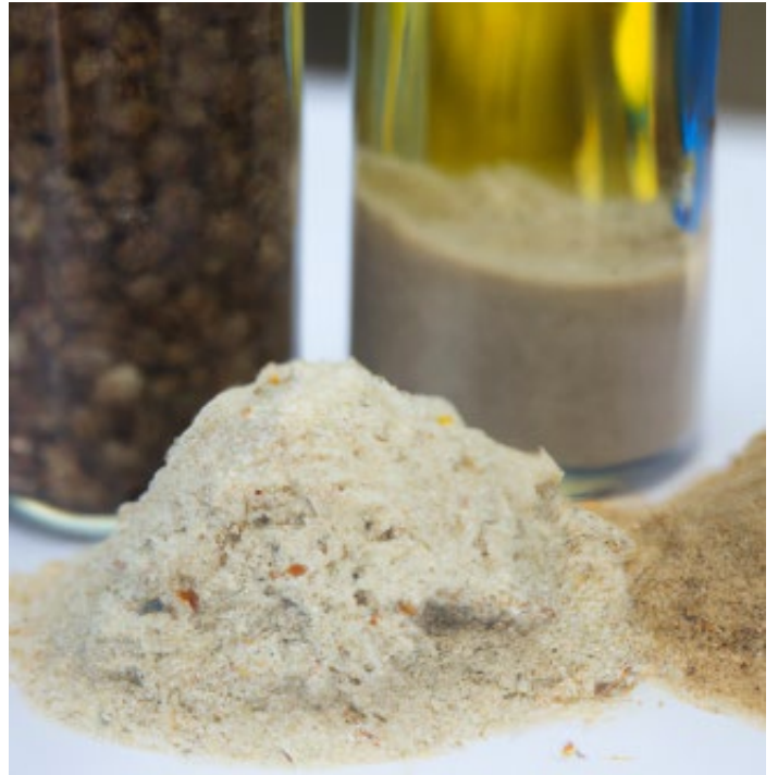
Figure 1: échantillon de produit fermenté – généré par l'IA DALL-E

La fermentation commence par une simple réaction chimique . Par exemple, lorsque la levure fermente le glucose, qui est un type de sucres , elle produit de l'alcool et du dioxyde de carbone . L'équation chimique de base pour ce processus est la suivante :